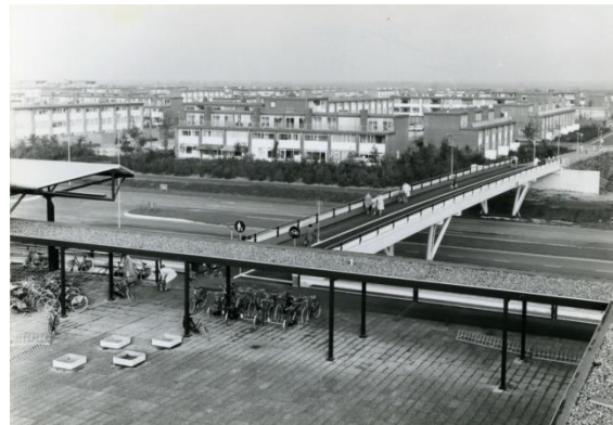
Zuiderzeewijk gezien vanaf het Brugplein, ca. 1970.