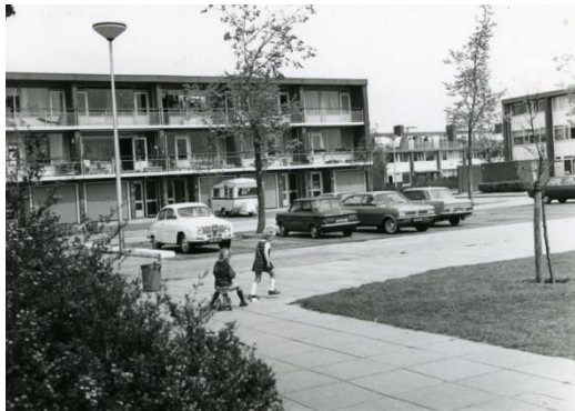
Spaanderbank ca. 1970.

In het lage deel bij de flat rechts ging in 1969 het buurtcentrum De Joon van start. Na enkele jaren verhuisde De Joon naar de Bosplaat (nabij de Waddenlaan).