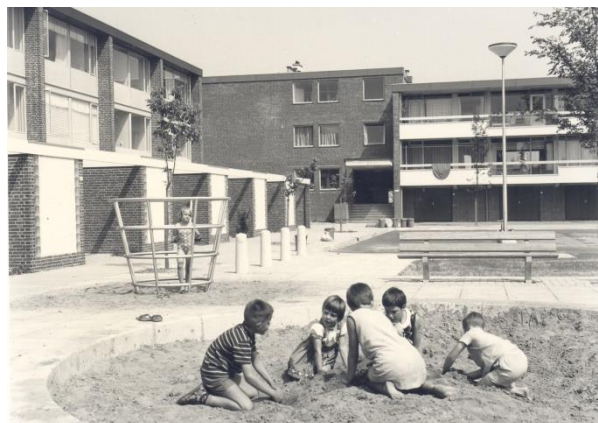
Marderhoek ca. 1970.

fysiotherapeut J.H. Helmink hun praktijk uit. Na