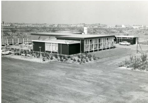
Café-Restaurant De Meerkoet

Op een kruising van fietspaden in het Stadspark slaan we LA en gaan direct weer LA het voetpad op. Na de heemtuin gaan we een trap af en lopen dan langs de speeltoestellen en daarna over de stoep achter de heg.